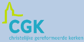
Christelijke Gereformeerde Kerken in Nederland