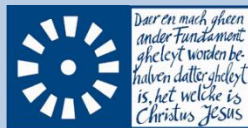
Algemene Doopsgezinde Sociëteit